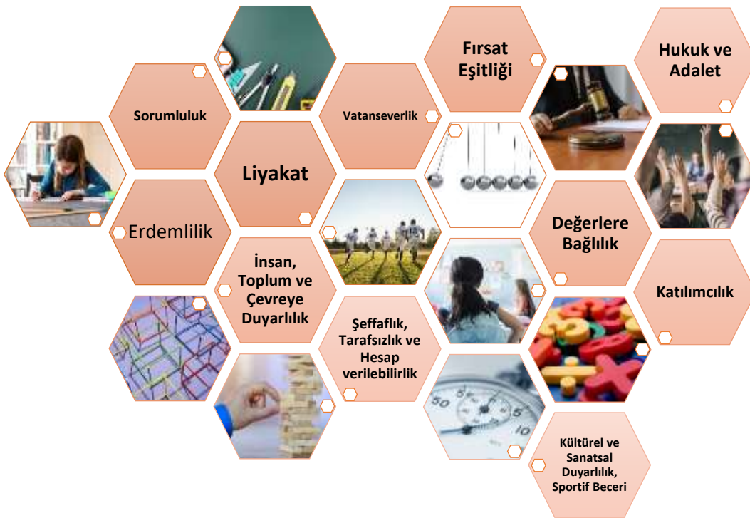
Şekil 4 Temel Değerlerimiz