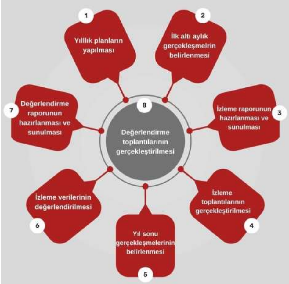
Şekil 7 İzleme ve Değerlendirme Süreci