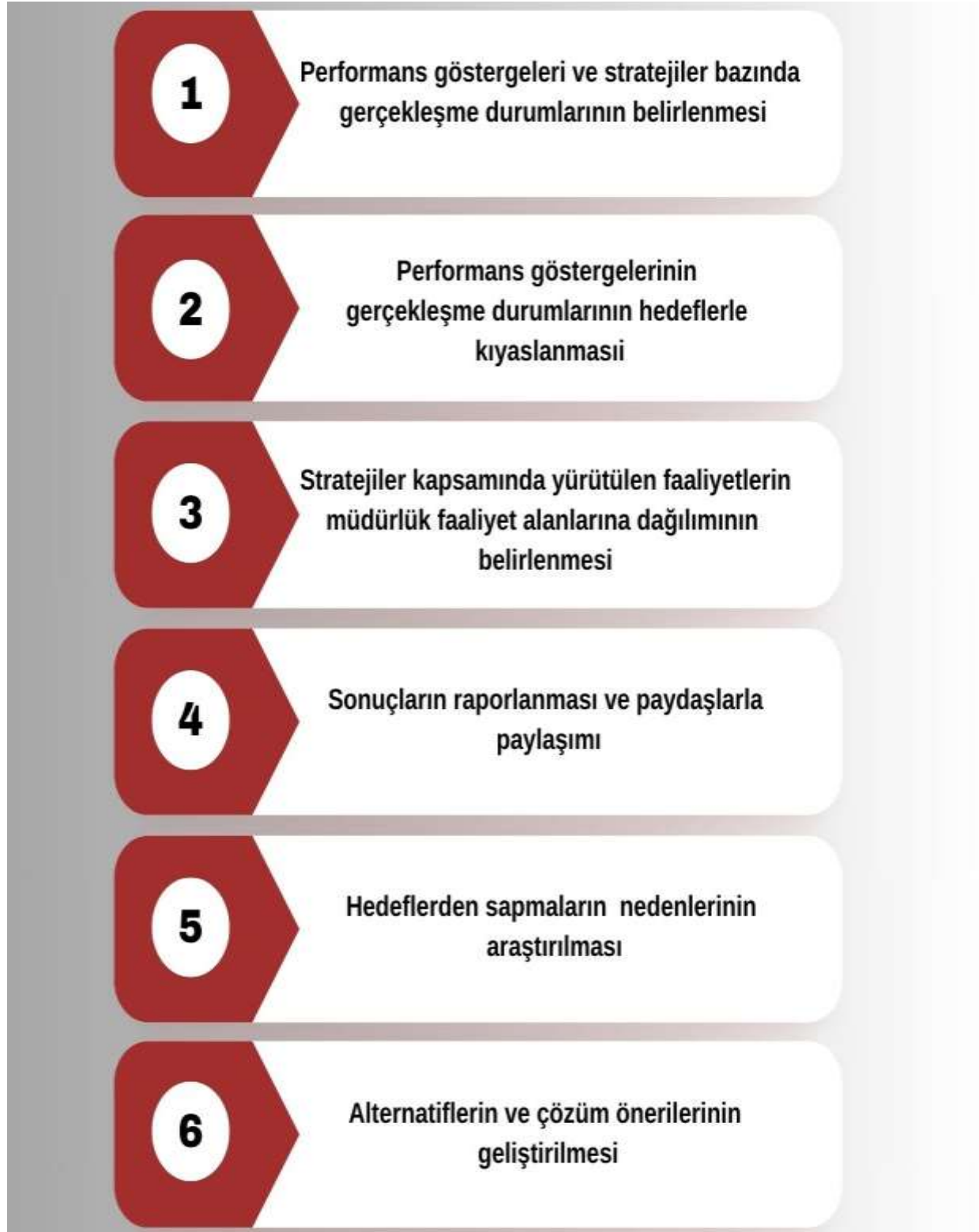
Şekil 6 Stratejik Plan İzleme ve Değerlendirme Modeli