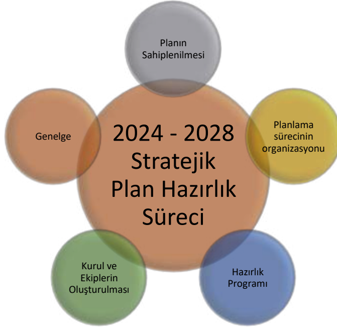
Şekil 1 Stratejik Plan Hazırlık Süreci