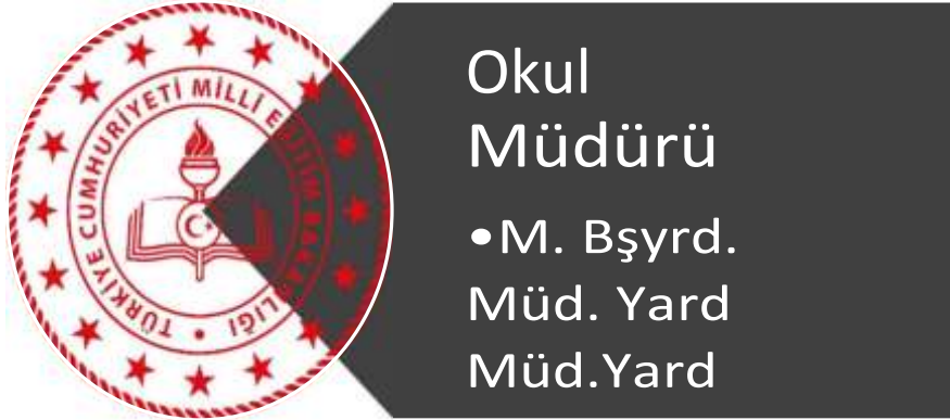
Şekil 3 Organizasyon Şeması